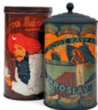
← Dózy plechové od kávy: Ode, G. Roust, Julius Meinl – 30.–40. léta 20. století

(10 × 8 × 12 cm; v. 10 cm, prům. 7 cm; 9 × 7 × 14 cm; NZM 86799/30, 86799/37, 113774)