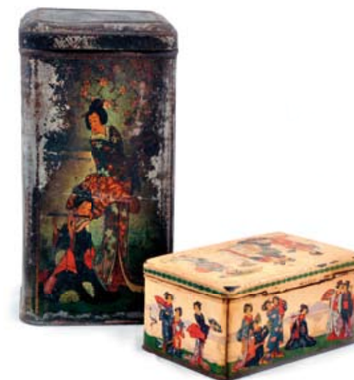
← Plechové dózy od čajů: Pickwick tea, Tea – 90. léta 20. století (7x7x8 cm; 4x4x6 cm; NZM 24/2009, 113652)

Tin tea boxes: Pickwick tea, Tea – 1990s