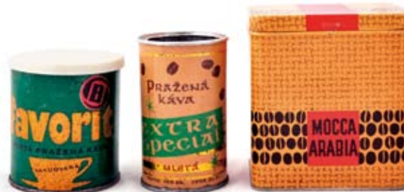
← Dózy plechové od kávy: Mocca Arabia, Favorit káva, Extra special mletá – Tuzex

(10 × 8 × 11 cm; v. 8 cm, prům. 7 cm; v. 10 cm, prům. 6 cm; NZM 113649, 24/2009, 113773)